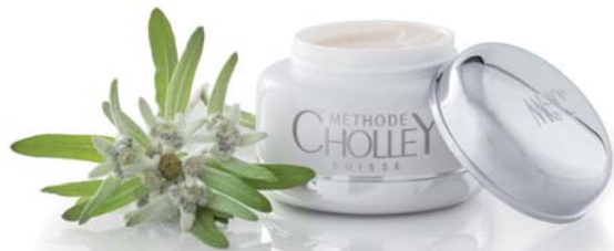
CHOLLEY® EDELWEISS DAY CREAM

BESCHERMT DE HUID TEGEN UVA-, UVB, VERVUILING EN VRIJE RADICALLEN